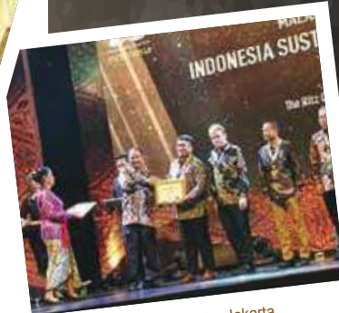
Hotel Borobudur Jakarta Raih Penghargaan Green Hotel

14 Masyarakat Berbondong bondong Hadiri Bakti Sosial Kesehatan Korps Marinir Dalam Rangka Menyambut HUT KORPS MARINIR KE 74