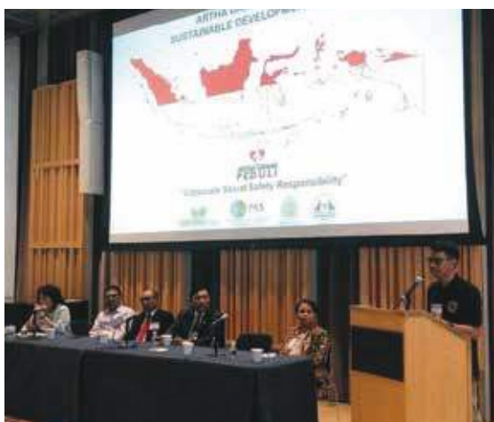
Artha Graha Peduli Bahas Isu Lingkungan di Forum New York

22 Bank Artha Graha Indonesia Lakukan Ekspansi Bisnis, Kini Hadir di Subang