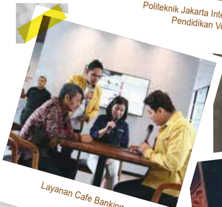
Layanan Cafe Banking