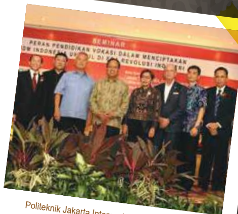
Politeknik Jakarta Internasional Saat Seminar Pendidikan Vokasi di Era 4.0