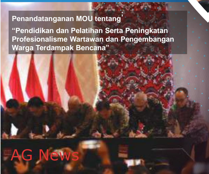
Penandatanganan MOU tentang “Pendidikan dan Pelatihan Serta Peningkatan Profesionalisme Wartawan dan Pengembangan Warga Terdampak Bencana”