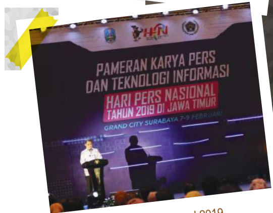
Hari Pers Nasional 2019