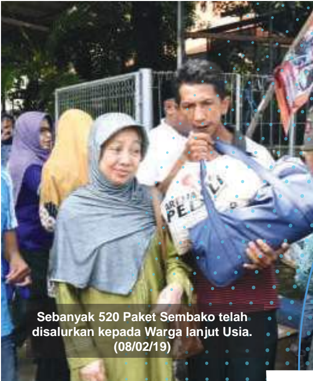
Sebanyak 520 Paket Sembako telah disalurkan kepada Warga lanjut Usia. (08/02/19)