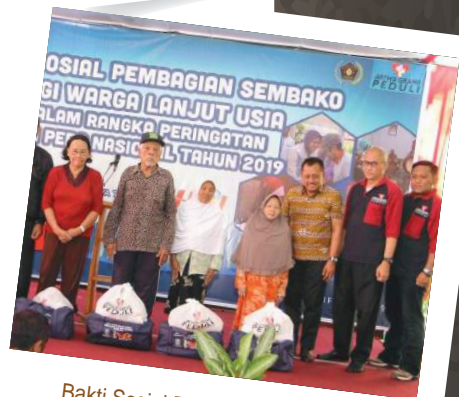
Bakti Sosial Pembagian Sembako Bagi Warga Lanjut Usia