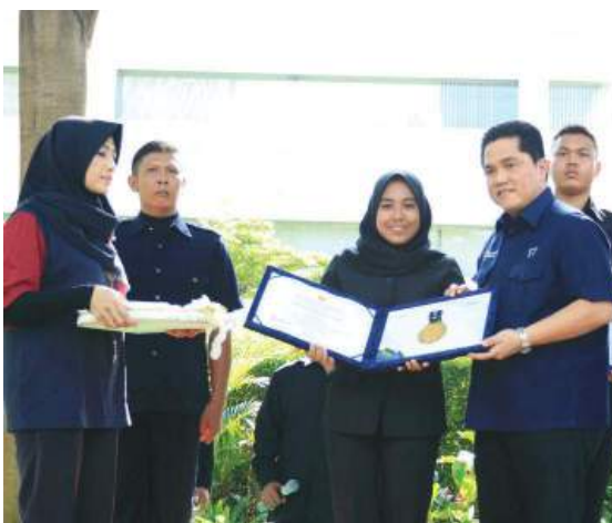
Pemberian penghargaan pemerintah atas prestasi AGP dalam mensukseskan ASIAN HAMES 2018 oleh INASGOC

BAKTI SOSIAL PEMBAGIAN SEMBAKO BAGI WARGA LANJUT USIA 13