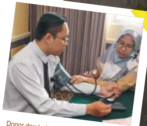
Donor darah di Hotel Borobudur Jakarta