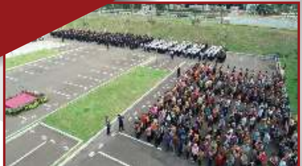
Suasana saat Upacara 17 Agustus berlangsung.