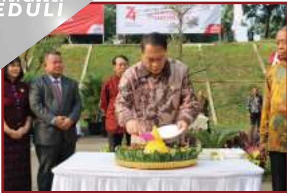
Pemotongan Tumpeng setelah Upacara Selesai