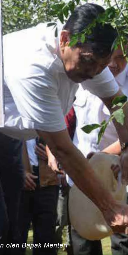
Penanaman Pohon oleh Bapak Menteri