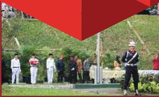
Momen saat pengibaran Bendera Merah Putih