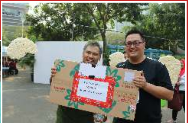
Pemenang Juara 1 Lomba Makan Kerupuk