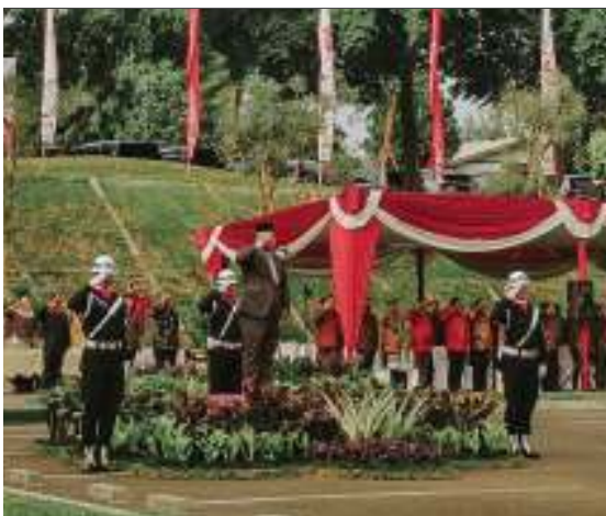
Upacara HUT RI ke 74