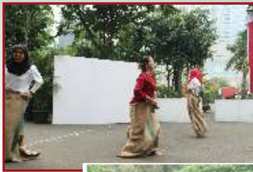
Peserta Lomba Balap Karung