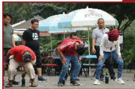
Lomba Memasukan paku ke botol