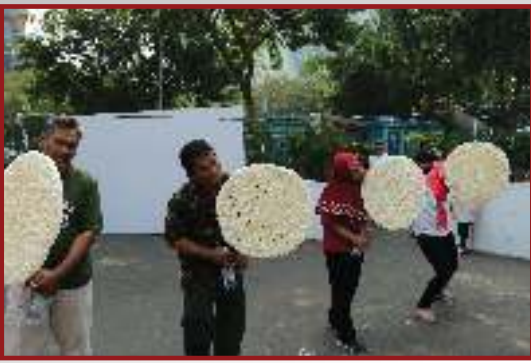
Lomba Makan Kerupuk yang diadakan di Pasar Akhir Pekan SCBD