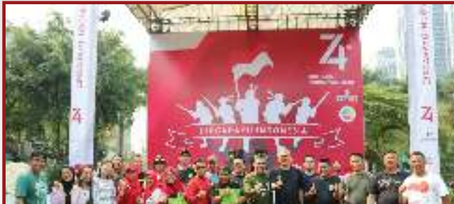
Para Pemenang lomba dan panitia lomba 17 Agustus