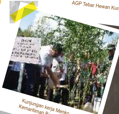
Kunjungan kerja Menko Kemaritiman Bapak Luhut