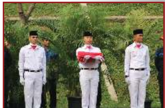
Petugas Paskibraka saat Upacara berlangsung