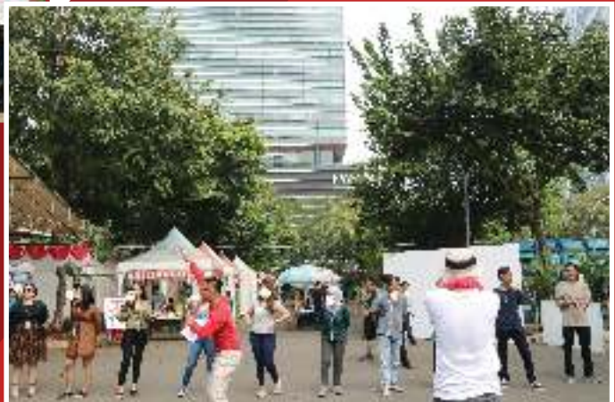
Suasana saat Lomba Makan Kerupuk Berlangsung