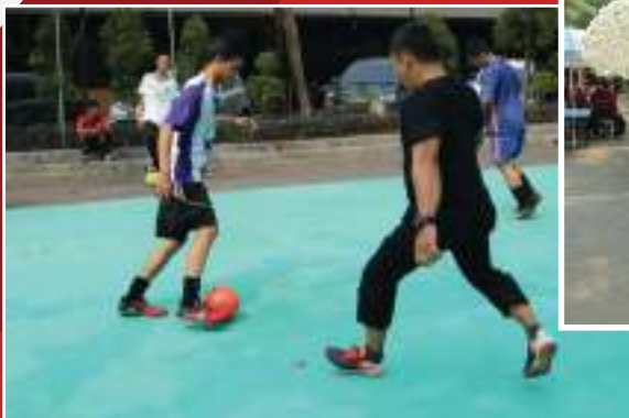
Momen saat Lomba Futsal berlangsung